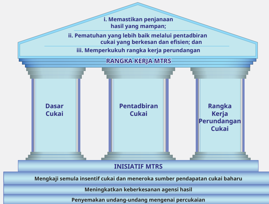
RAJAH 2. Rangka Kerja Strategi Hasil Jangka Sederhana di Malaysia