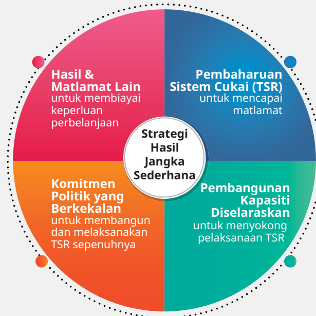
RAJAH 1. Komponen Utama Strategi Hasil Jangka Sederhana